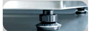
Füsse sind höhenverstell- und arretierbar.