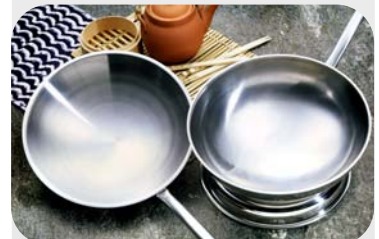
Zwei Wok-Pfannen in verschiedenen Größen: links Halbkugel-Wok-Pfanne 5,2 Liter, rechts Kugel-Wok-Pfanne 9,5 Liter Inhalt.