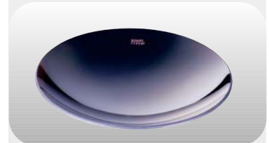
Hochqualitative Ceran-Cuvette für eine optimale Wärmeverteilung.