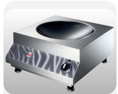
Wok-Line, voll im Front-Cooking-Trend. Internationale Küche ohne Aufwand.