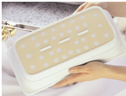
Induktionstaugliche GN-Porzellanschalen (Abb.Unterseite)