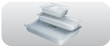
GN-Porzellanschalen in 3 Grössen