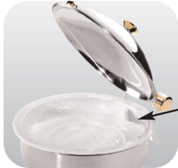
Runde Porzellanschale für den Roundchafer